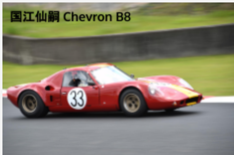
国江仙嗣 Chevron B8