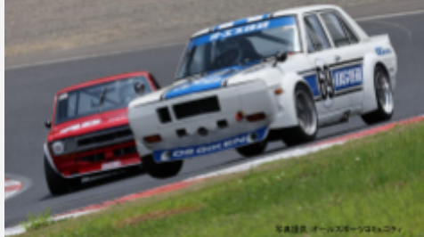
1位 河上正治 サニー