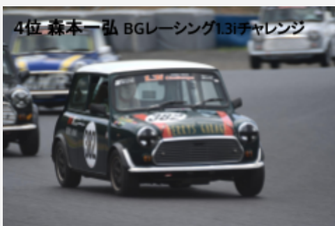
4位 森本一弘 BGLレーシング1.3iチャレンジ