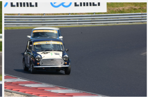
5位 BGRレーシングイエローキャブ 高橋宏 竹知克征