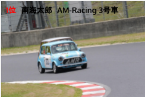
1位 南海太郎 AM-Racing 3号車