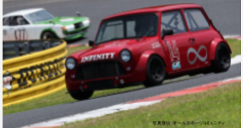
1位 大島和也 インフィニティミニ