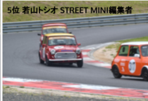
5位 若山トシオ STREET MINI編集者