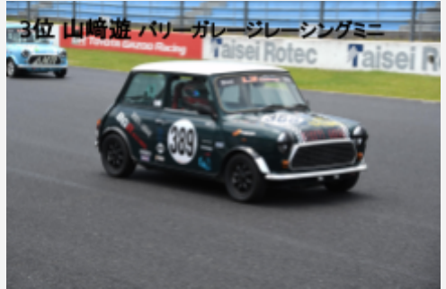
3位 山崎遊 バリーガレージレーシングミニ