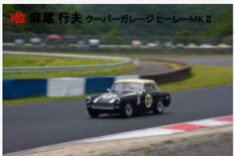
1位 麻尾 行夫 ケーパーガレージヒーローMK II