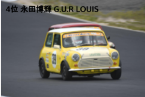
4位 永田博輝 G.U.R LOUIS