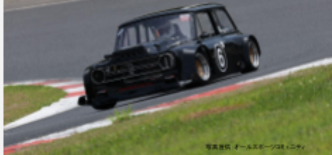
1位 長崎紀治 メカドックMRGモンスター