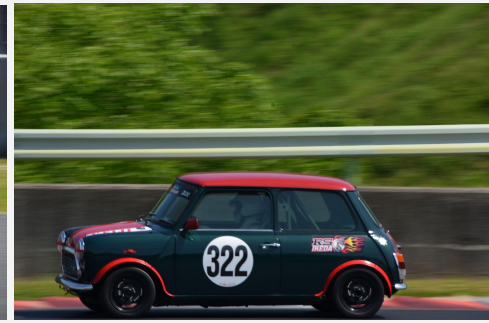
4位 イズミスピリッツ 永田博輝 道正田均 森一之義