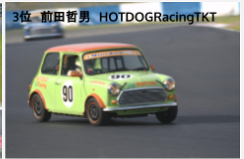
3位 前田哲男 HOTDOGRacingTKT