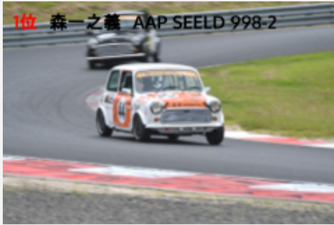
1位 森一之義 AAP SEELD 998-2