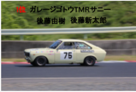
1位 ガレージゴトウTMRサニー 後藤由樹 後藤新太郎