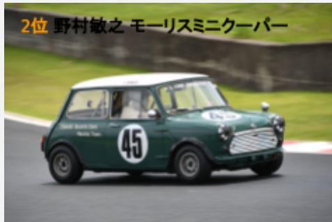
2位 野村敏之 モーリスミニクーパー