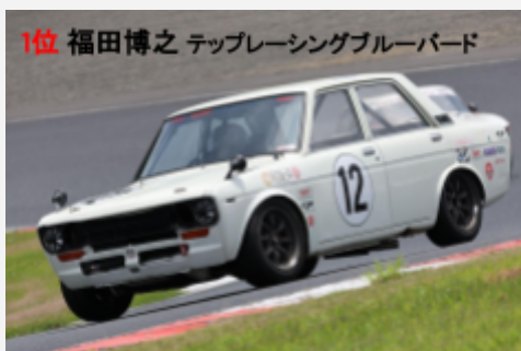
1位 福田博之 テップレーシングブルーバード