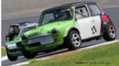
2位 倉本一史 VTECレーシング・ライト