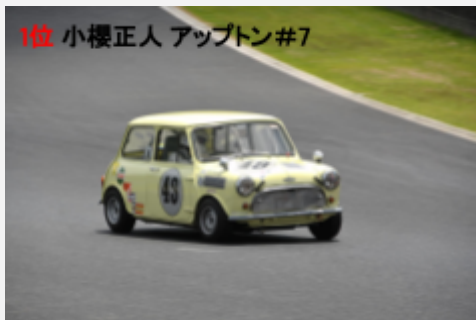
1位 小櫻正人 アップトン#7