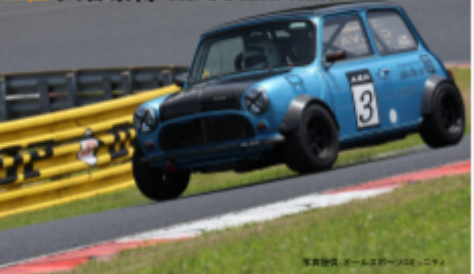
2位 大谷泰博 tta ootani mini