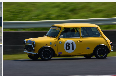
6位 G.U.R FC-R 戸田豊 渡邊博 曾川典昭