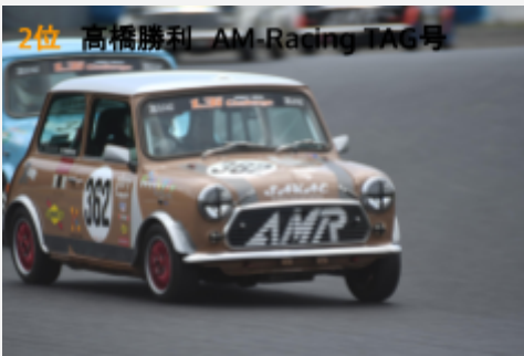
2位 高橋勝利 AM-Racing TAG号