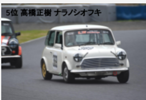
5位 高橋正樹 ナラノシオフキ