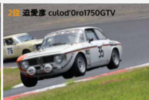
2位 追愛彦 culod'Oro1750GTV